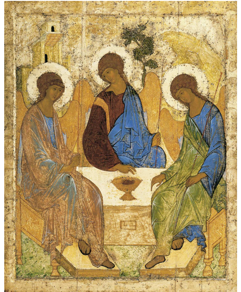
STS. GREGORY AND ROMANOS GUILD CHAMPAIGN-URBANA, IL